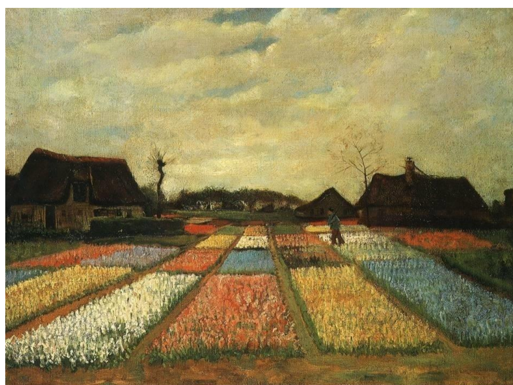
Vincent van Gogh, Flower Beds in Holland , 1883