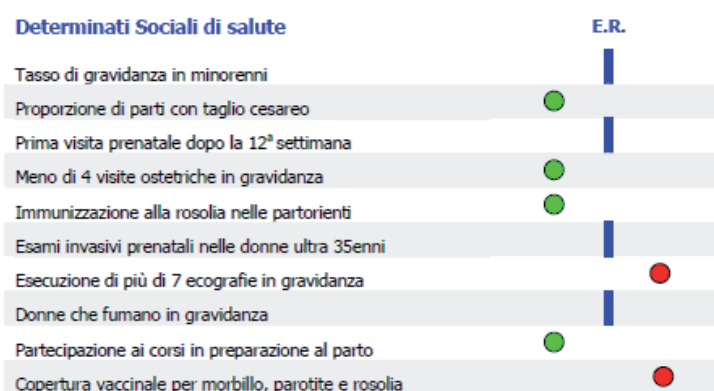
Figura 1. Azienda USL di Cesena ed Emilia-Romagna (E.R.): confronto degli indicatori

Il primo esempio si riferisce al confronto tra il dato relativo all'indicatore rilevato a livello dell'Azienda USL di Cesena e il valore medio regionale. Gli altri due esempi mostrano per ogni indicatore l'eventuale presenza di disuguaglianze rispetto ai diversi determinanti considerati (età, sesso, cittadinanza, titolo di studio, ...).