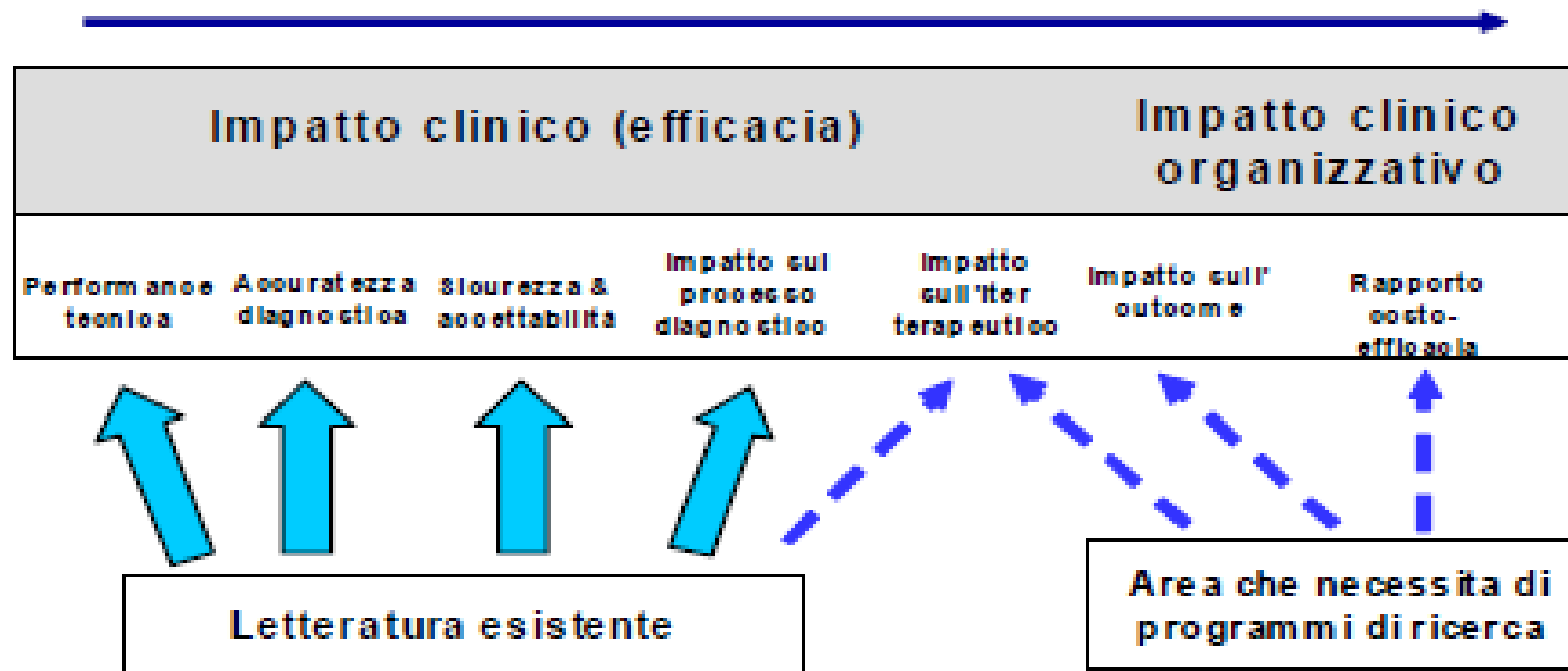
Figura 1. Evidence profile per un test di valutazione diagnostica